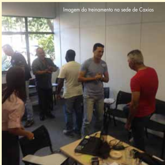
Imagem do treinamento na sede de Caxias