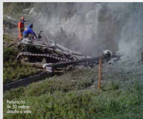
Perfuração de 50 metros: desafio à vista