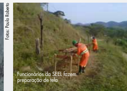
Funcionários da SEEL fazem preparação de tela