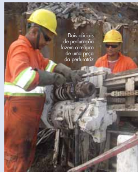
Dois oficiais de perfuração fazem o reparo de uma peça da perfuratriz