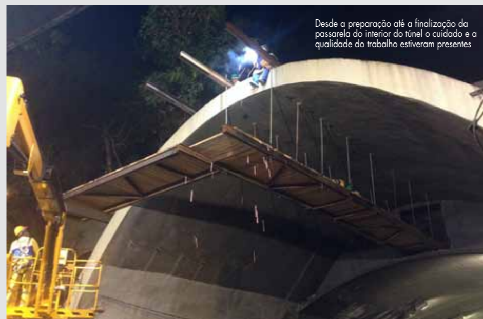
Desde a preparação até a finalização da passarela do interior do túnel o cuidado e a qualidade do trabalho estiveram presentes