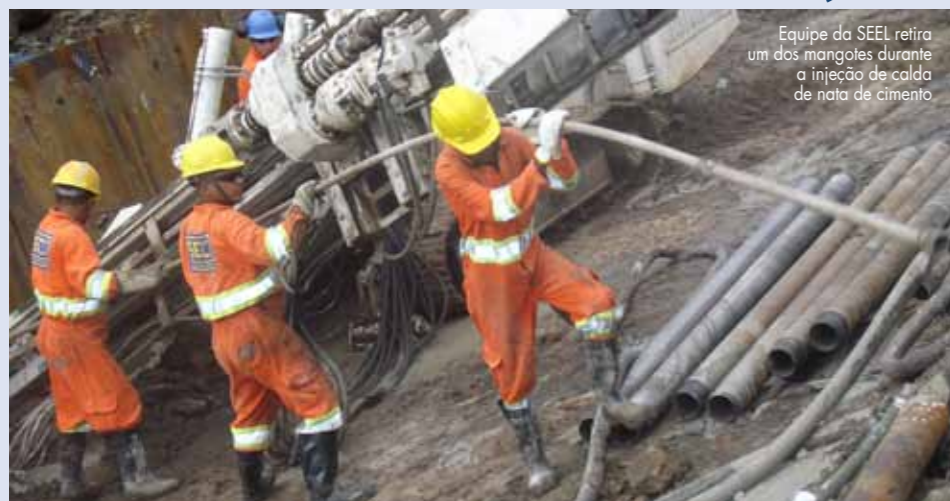
Equipe da SEEL retira um dos mangotes durante a injeção de calda de nata de cimento