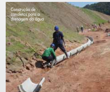
Construção de canaletas para a drenagem da água

Ainda que não haja uma margem de imprecisão, a Obra 667 deve estar concluída até o final de março. Até o final de janeiro, sete das dez erosões já haviam sido finalizadas.