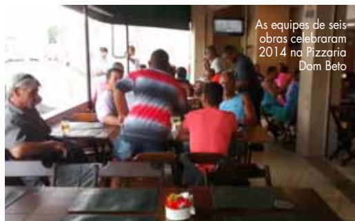
As equipes de seis obras celebraram 2014 na Pizzaria Dom Beto