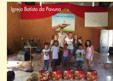
Igreja Batista da Pavuna