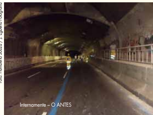
Internamente - O ANTES