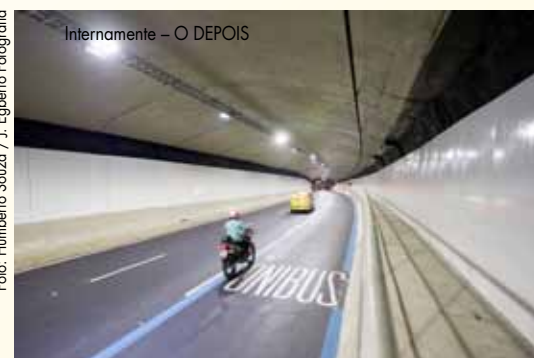
Internamente - O DEPOIS