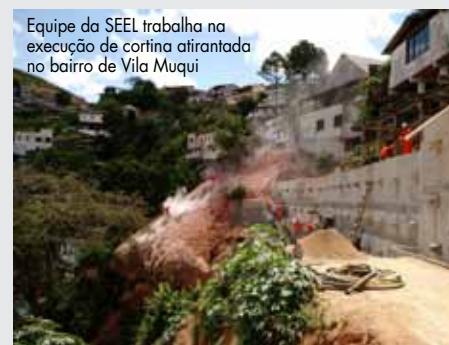
Equipe da SEEL trabalha na execução de cortina atirantada no bairro de Vila Muqui