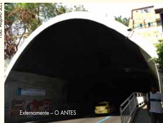
Externamente - O ANTES