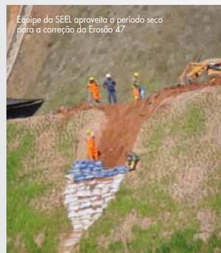
Equipe da SEEL aproveita o período seco para a correção da Erosão 47