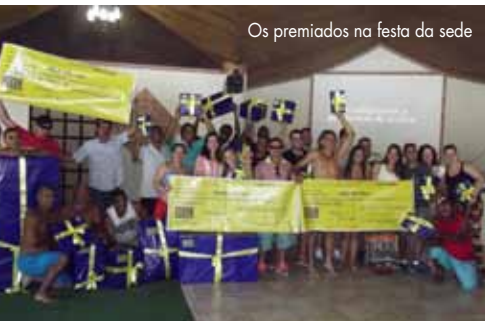
Os premiados na festa da sede