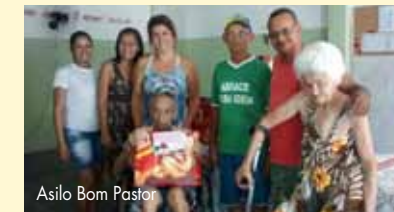
Asilo Bom Pastor

Ganhamos de presente no último dia 21 de dezembro o sorriso de 45 crianças da Igreja Evangélica Congregacional, no bairro de Parque Modelo, em Niterói. Ou melhor: