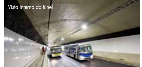
Vista interna do túnel