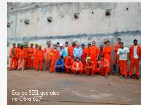
Equipe SEEL que atua na Obra 627