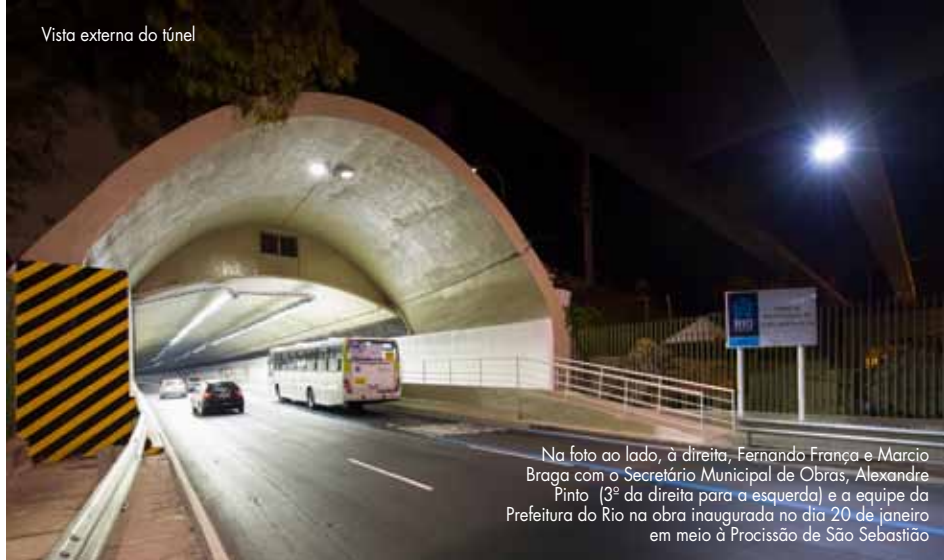
Vista externa do túnel