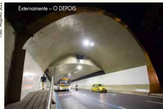
Externamente - O DEPOIS