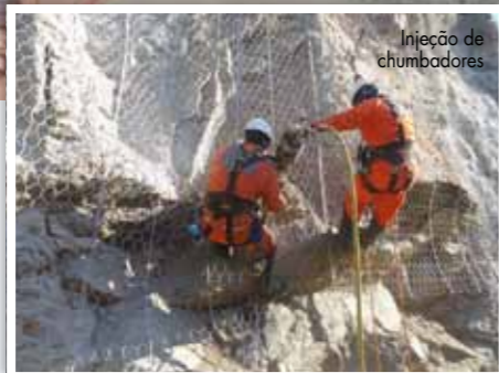
Injeção de chumbadores

Mais importante do que entregar obra no prazo, cumprindo requisitos, é preocupar-se em criar registros dos acertos e erros, de avaliação de procedimentos e condutas. Vale muito a pena ouvir do cliente a resposta à famosa e simples pergunta “Como eu fui?”. Geralmente, o resultado traz lições e referências úteis a empreendimentos futuros. A cada obra concluída na SEEL tem sido realizada uma Reunião de Encerramento.