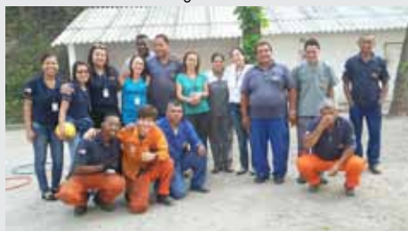
Colaboradores de diversas áreas da SEEL posam para imagem 1ª SIPAT em Outubro de 2015

PG7 – SEEL realiza 1ª SIPAT (Semana Interna de Prevenção de Acidentes de Trabalho). Confira imagens e depoimentos!