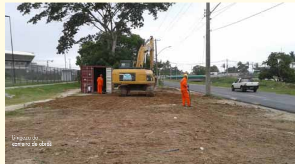
Limpeza do canteiro de obras

Após a finalização do Parque Olímpico aquela região da Barra da Tijuca (Rio) ganhará ares (e contornos reais) de um cartão postal carioca. Resultado: a demanda do fluxo de trânsito aumentará muito. Para desafogar o imenso nó que já existe no trecho próximo ao Hospital Sarah Kubitschek, a SEEL iniciou no mês de novembro a sua Obra 715 – a primeira com o cliente Carvalho Hosken — que construirá duas pontes, cada uma com 36 metros