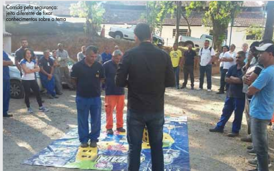
Corrida pela segurança: jeito diferente de fixar conhecimentos sobre o tema

Existem modelos divertidos e envolventes de intensificar as posturas que nos ajudam a evitar acidentes e a cuidar de nossa saúde e do meio ambiente. Entre os dias 20 e 23 de outubro, colaboradores da SEEL aproveitaram alguns deles ao participar, na sede de Caxias, de um momento histórico para a empresa: a 1ª SIPAT (Semana Interna de Prevenção de Acidentes de Trabalho).