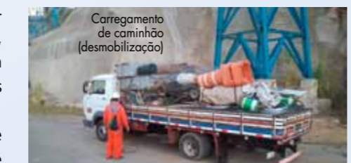
Carregamento de caminhão (desmobilização)