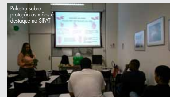
Palestra sobre proteção às mãos é destaque na SIPAT