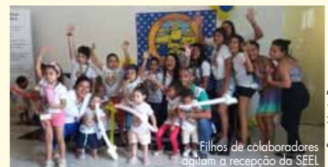
Filhos de colaboradores agitam a recepção da SEEL