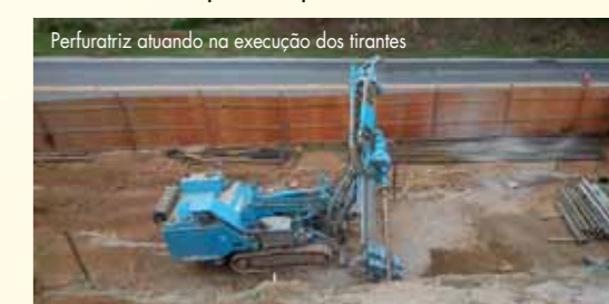
Perfuratriz atuando na execução dos tirantes

O cliente Rota 116 confia que o resultado de nossos serviços ajudará a região suportar o nível de chuvas previsto para o início de 2016.