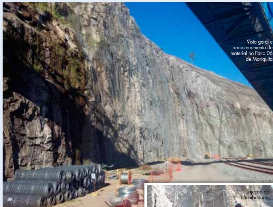
Vista geral e armazenamento de material no Pátio 06 de Mariquita