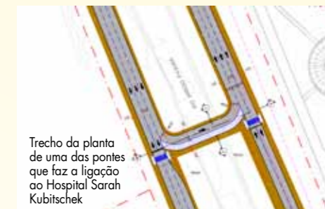
Trecho da planta de uma das pontes que faz a ligação ao Hospital Sarah Kubitschek

“Para a SEEL é uma obra muito importante para buscar novas referências, pois estamos realizando duas etapas do empreendimento (fundação e erguimento das pontes), são diversos procedimentos de engenharia, o que não é muito comum em nossa dinâmi-