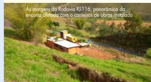
Às margens da Rodovia RJ-116, panorâmica da encosta afetada com o canteiros de obras instalado